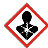
GHS 08 Gesundheitsgefahr