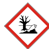
GHS 09 Umwelt

Gefahrenpiktogramme sind rot umrandete Rauten mit schwarzem Symbol auf weißem Grund. Ein Produkt kann mit mehreren Piktogrammen gekennzeichnet sein.