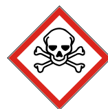
GHS 06 Totenkopf mit gekreuzten Knochen