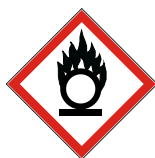
GHS 03 Flamme über einem Kreis

In einigen Anlagen auf dem Werksgelände werden Stoffe gelagert und verwendet, von denen besondere Gefahren ausgehen können weil sie brandfördernd, ätzend, giftig, gesundheitsgefährdend, oder umweltgefährdend sind. Im weltweit harmonisierten GHS Einstufungs- und Kennzeichnungssystem werden die gefährlichen Eigenschaften von Chemikalien mit Gefahrenpiktogrammen dargestellt. Hierbei handelt es sich um folgende Gefahrenpiktogramme: