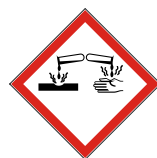
GHS 05 Ätzwirkung